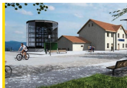
Vizualizace podoby dopravního terminálu v Mor. Třebové kraj Vysočina. Jedná se o přeložku stávající silnice II/150 v celkové hodnotě více jak 53 mil. Kč.

V kraji Vysočina bude provoz Havlíčkův Brod pokračovat v realizaci další významnější zakázky, jejíž dokončení je naplánováno na první pololetí. Jedná se o realizaci stavby „I/37 Žďár nad Sázavou – Ostrov nad Oslavou“ pro ŘSD správa Jihlava. Dále se v jarních měsících rozjedou práce na zakázce „II/150 Pavlíkov – Leštinka“ tentokrát pro