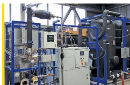
Expedice aparátů pro Clausovu jednotku MOZYR, únor 2018

dávka Systému pro odstraňování radonu pro čínského klienta. Tyto technologické systémy jsme již několikrát na stránkách Zpravodaje představovali, jedná se o kompaktní technologická zařízení, která zajišťují 99,99% zachycení radonu obsaženého ve vzduchu. Jsou využí-